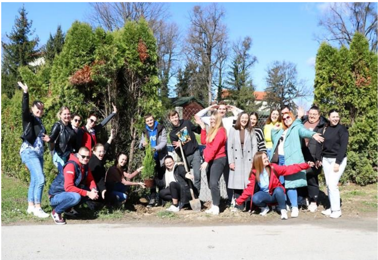
2. sjednica 4. saziva Skupštine mladih Hrvatskog Crvenog križa, 15. – 17. ožujka 2024. godine, Centar za edukaciju GDCK Osijek u Orahovici

Skupštinu mladih Hrvatskog Crvenog križa čine predstavnici mladih iz gradskih i općinskih društava Crvenog križa i trenutni, 4. saziv broji ukupno 59 predstavnika u dobi od 18 do 30 godina, čiji je doprinos od neupitne važnosti za realizaciju različitih vrsta aktivnosti na lokalnom nivou i razvoja Crvenog križa na nacionalnom i međunarodnom nivou.